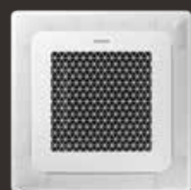
Wind-Free™ 4-vejs Kasette