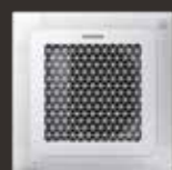
Wind-Free™ Mini 4-vejs Kasette